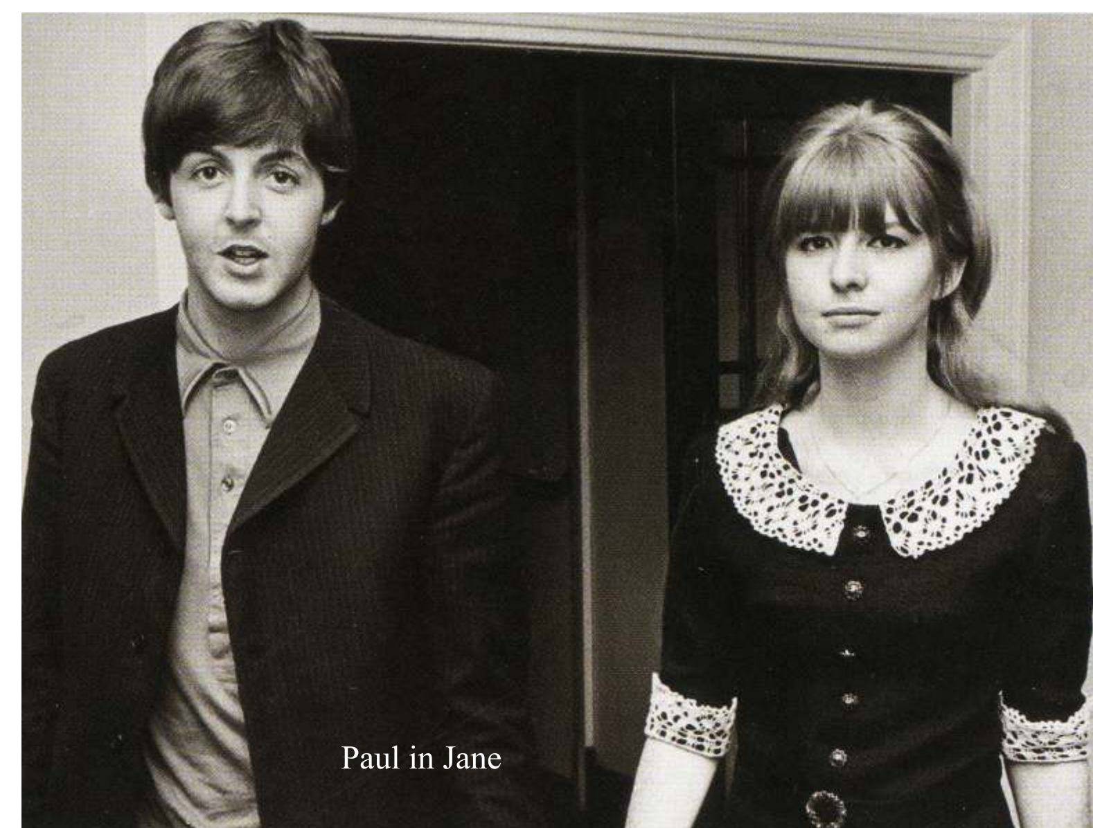
Paul in Jane

Beatli so jo po koncertu povabili na pijačo. S Paulom sta se zaklepetala pozno v noč. Naslednjih nekaj tednov sta šla velikokrat ven. Ko se je Paul vrnil z dopusta, sta ga na londonskem letališču pričakali Jane in njena mama. Zamudil je zvezo za Liverpool, zato sta mu ponudili, da lahko prenoči pri njih. Paul tega ni hotel. Takšnih stvari fantje iz delavskega razreda pač ne počno. Toda nazadnje je pristal, a le za eno noč. Ta noč se je spremenila v tri leta. Vse do konca leta 1966, ko je kupil lastno hišo, je Paul ves čas, ko je bil v Londonu, stanoval pri Jane.