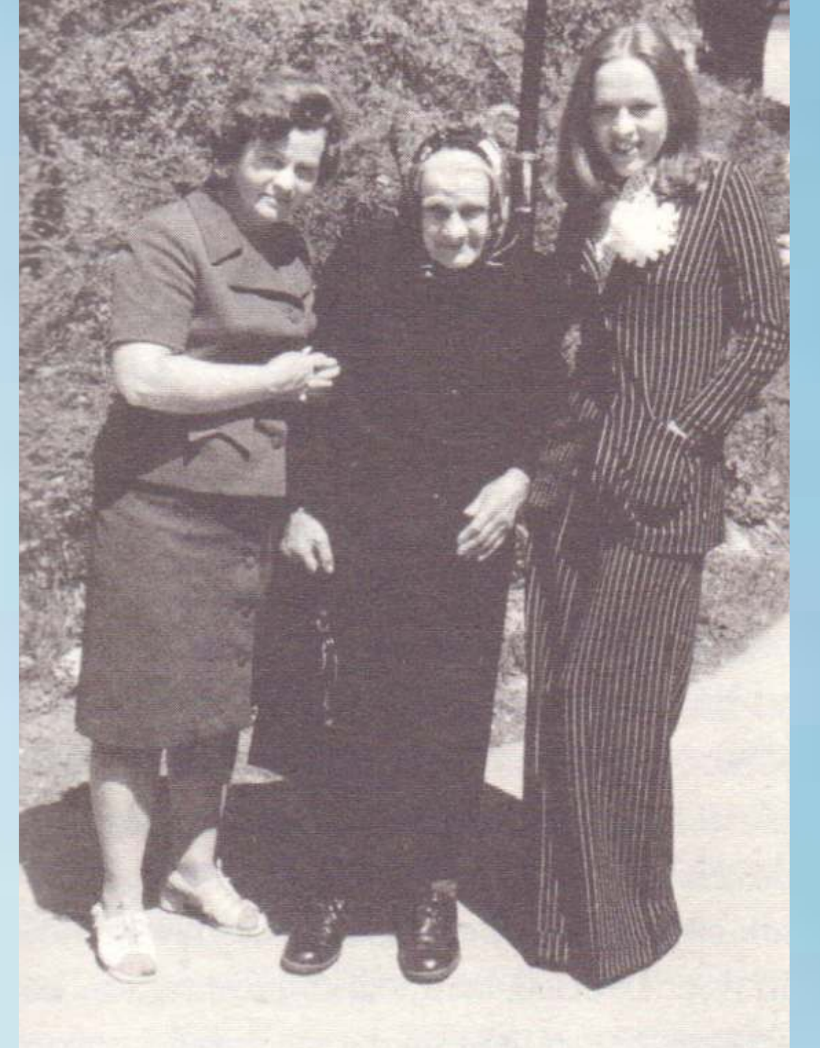
Z mamo in staro mamo na poroki z Racem

Že velikokrat sem rekla, pa bom še zdaj: z Racem sva velika prijatelja in bova to ostala do konca življenja. Že vse življenje tudi delava skupaj in v vseh kombinacijah odlično funkcionirava, le kot mož in žena ne. Pravzaprav niti sama ne vem, zakaj. Najbrž sva bila premalo zaljubljena drug v drugega, razumevanje in prijateljstvo pa včasih nista dovolj. To je bil zgrešen projekt, ki ni pustil hujših posledic.