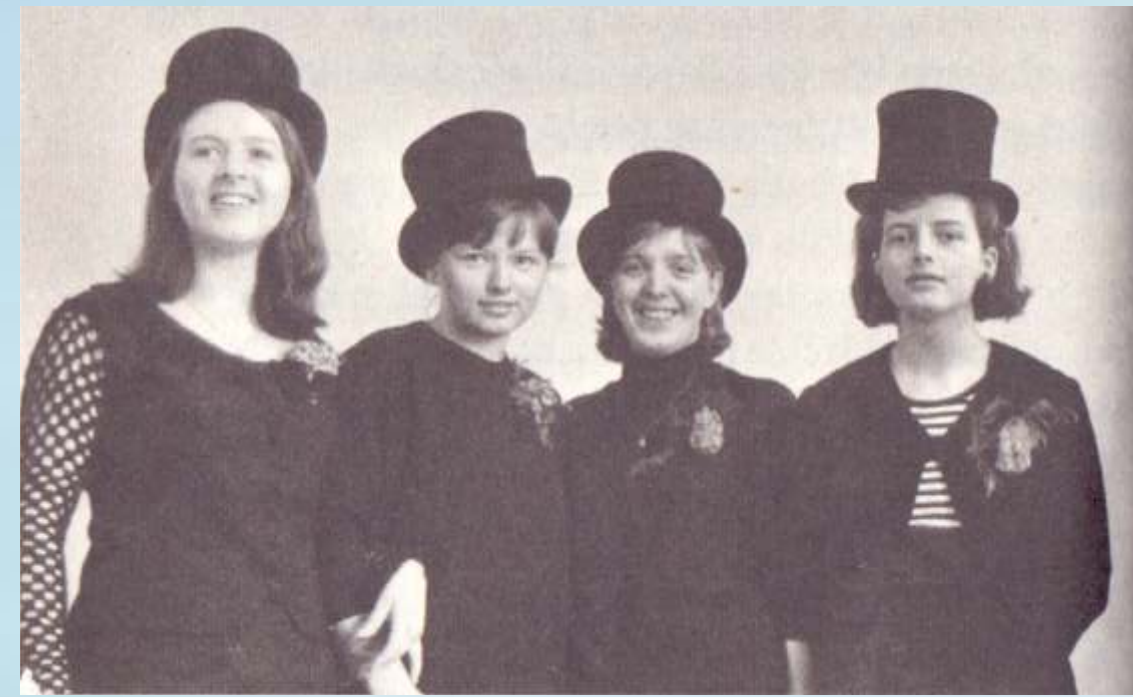
S prijateljicami iz gimnazije

V naši vasi se je kar naprej nekaj dogajalo, za kar so poskrbeli mladi, čeprav se meni takrat vsi niti niso zdeli mladi. Pripravljale so se igre, praznoval se je pust, ki je bil velik praznik, zmeraj smo se uredili zanj, si izdelali kostume in potem sodelovali v sprevodu.