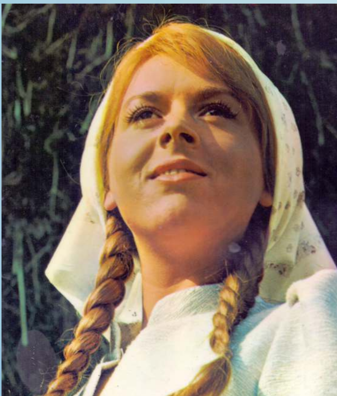
Cvetje v jeseni