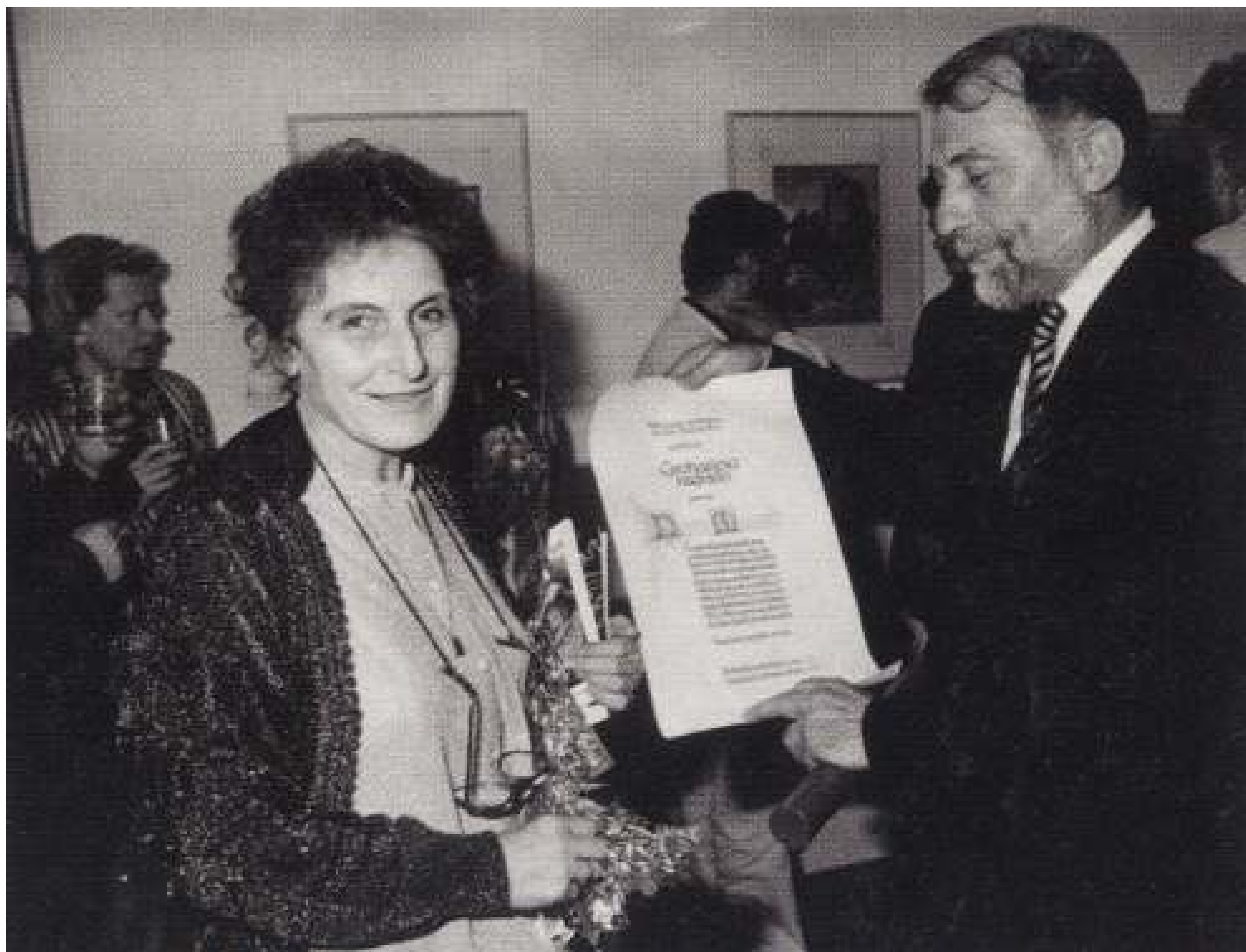
1991. Podelitev Groharjeve nagrade Neži za življenjsko delo. Škofja Loka.

Prva nagrada za literarno reportažo z delovnih akcij, 1959 Prva nagrada za otroško pesem leta - radio Beograd, 1961 Vse tri nagrade za otroško pesem leta - radio Ljubljana, 1964 Tomšičeva nagrada za novinarsko delo (potopis), 1967 Plaketa lista Radost (Zagreb), 1970 Plaketa lista Ciciban, 1975 Zlata značka ZPM in posebno priznanje Zveze bralnih značk za temeljni prispevek k bralni kulturi slovenske mladine, 1980, 1985 Srebrna plaketa za posebno prizadevanje pri razvoju novinarstva, 1985 Nagrada Prešernovega sklada, 1987 Prva nagrada Mladike (Trst) za poezijo, 1989 Prešernova nagrada Gorenjske za literaturo, 1989 Groharjeva nagrada za življenjsko delo, 1991 Priznanje Gibanja za kulturo miru in nenasilja, 1991 Plaketa mesta Škofja Loka za celoten literarni opus, 1997 Častna občanka rojstne občine Polzela, 1999 Slovenka leta 2008 Zlatnik poezije 2010