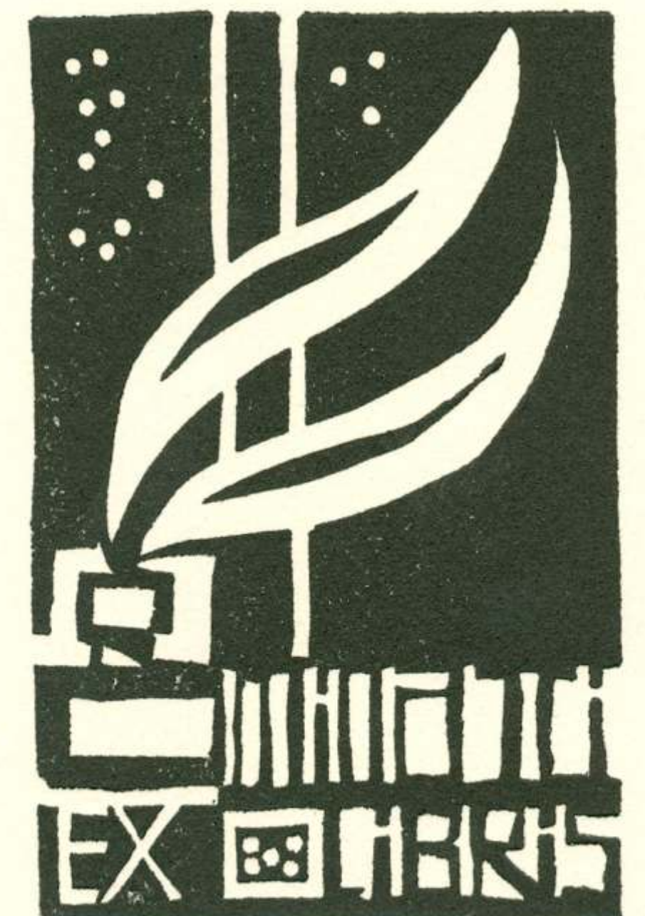
Arpad Šalamon: Črnlnik (ex-libris)

O, v mladih brezah je tisoč življenj za vse tiste, ki ne znajo živeti in le mimo življenja gredo kot slepci in zagrenjeni poeti.