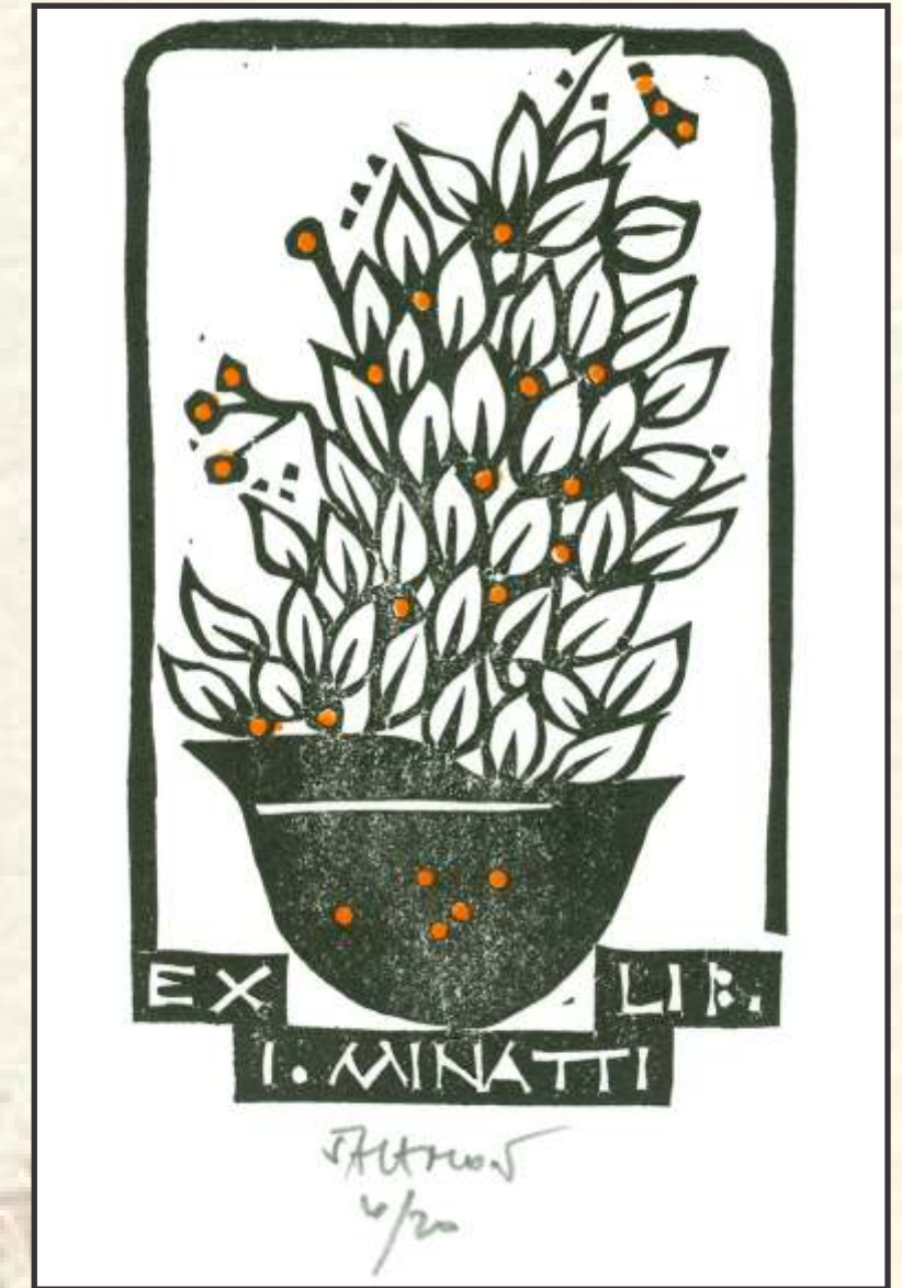
Arpad Šalamon: Svoboda (ex-libris)