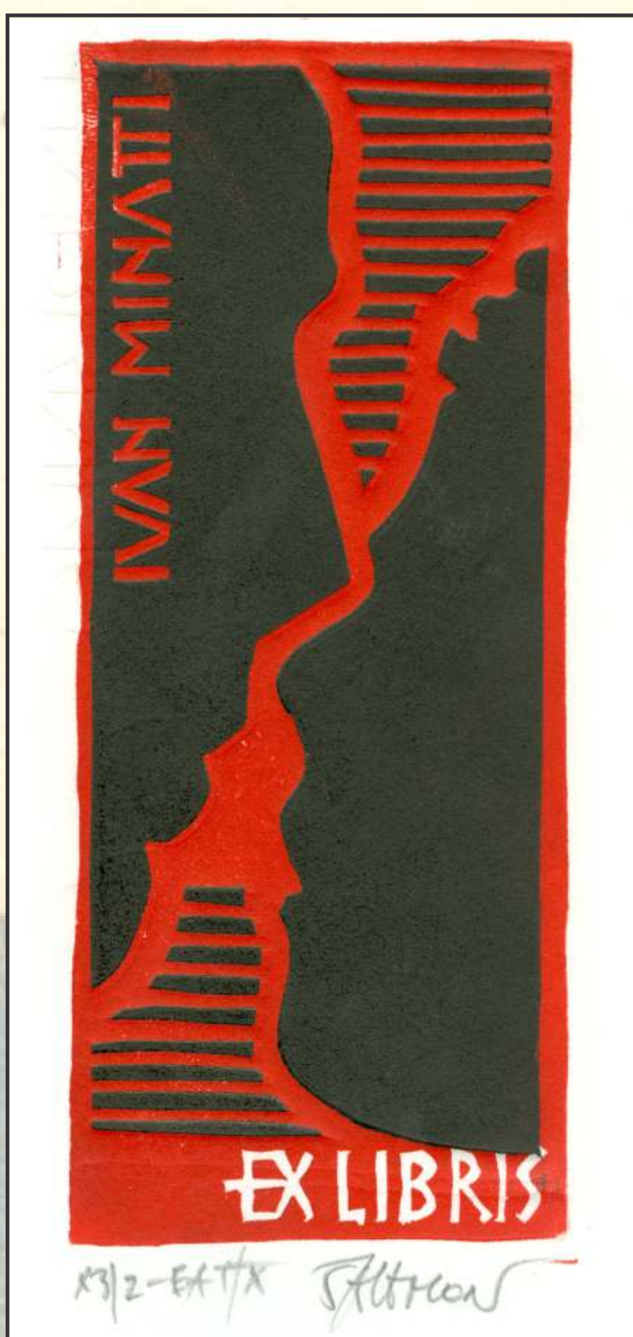
Arpad Šalamon: Poljub (ex-libris)