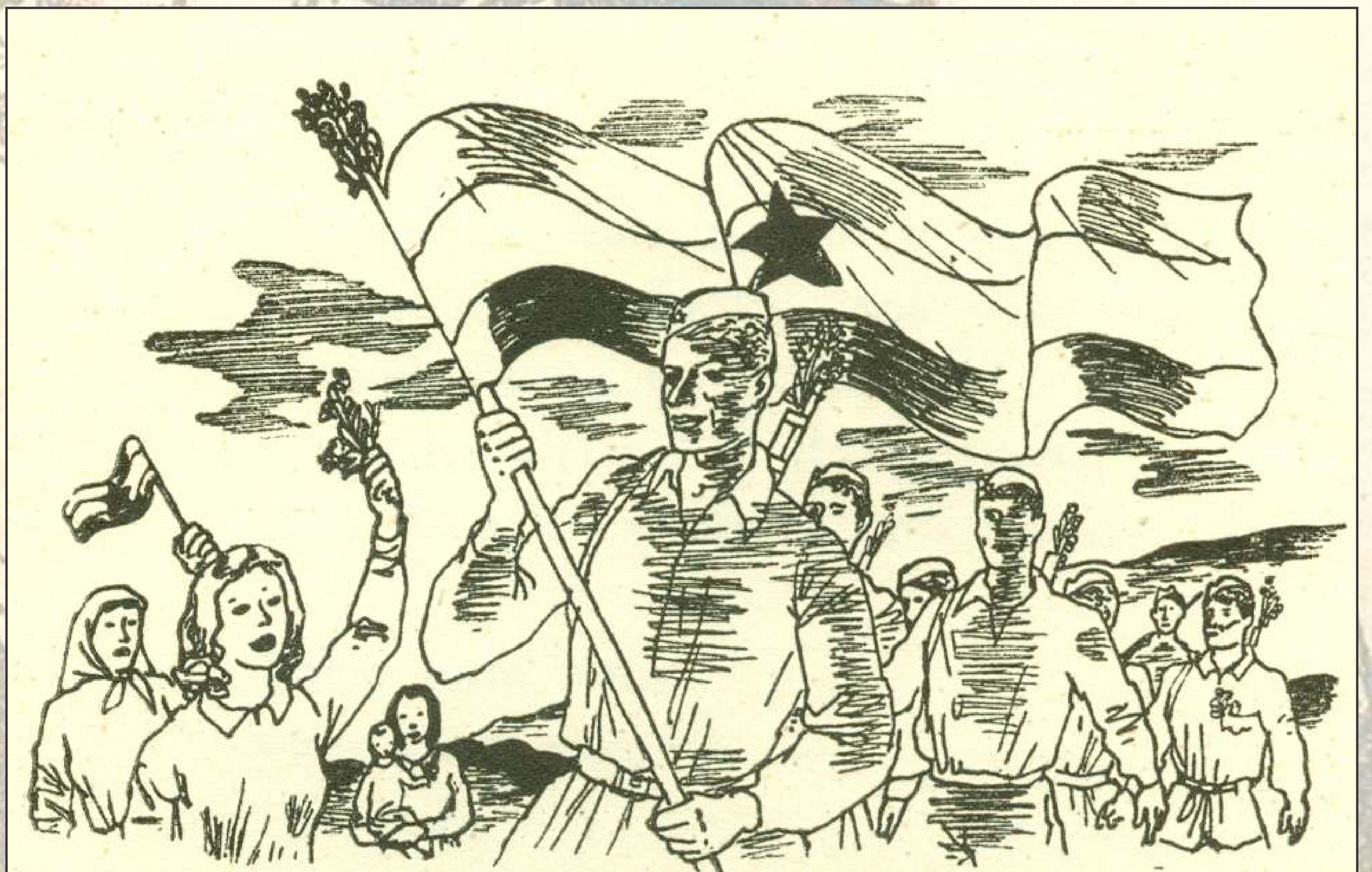
Tudi v partizanih je pisal in objavljajal pesmi