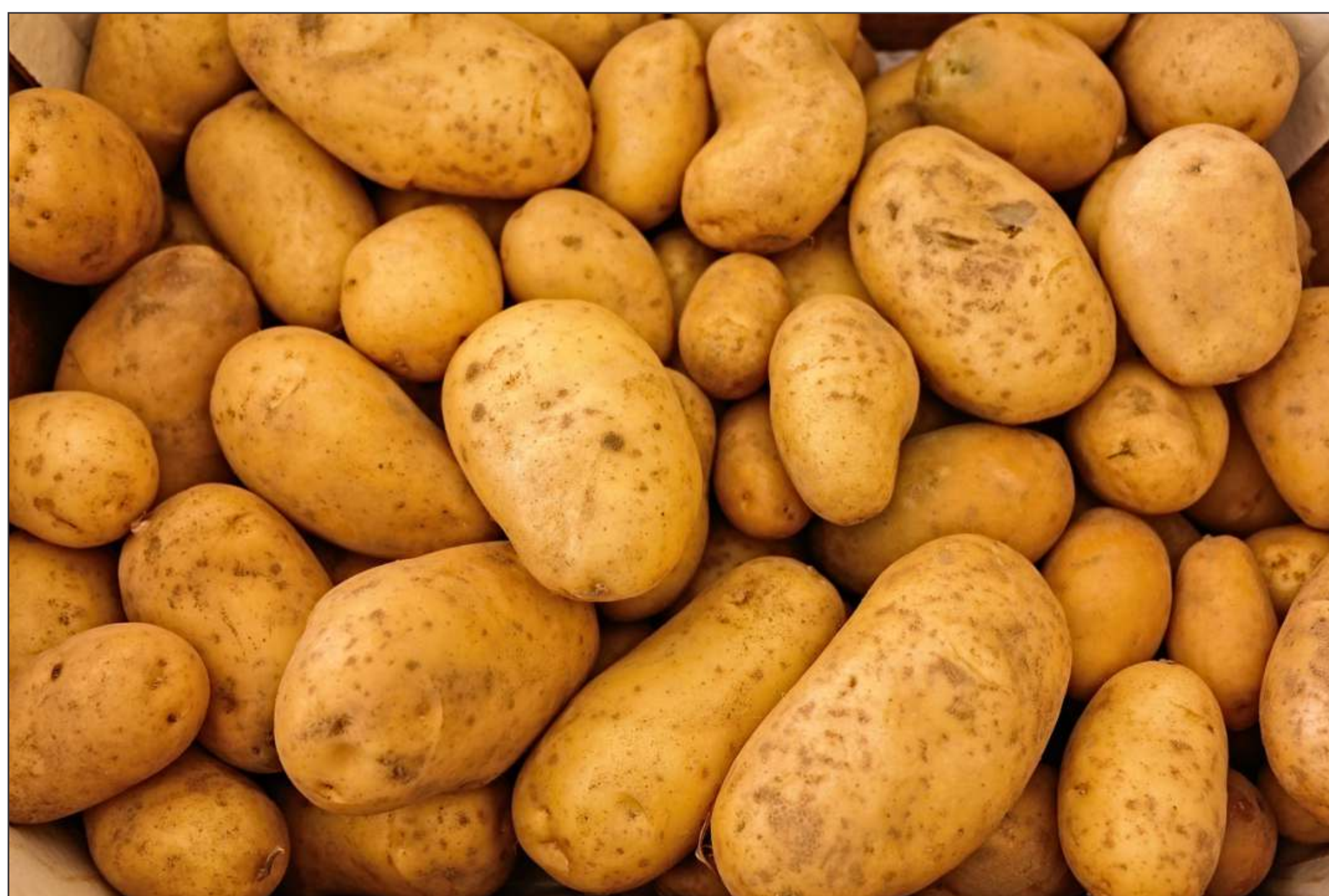
Vsestransko uporaben gomolj

Opeklino zdravimo s presnim nastrganim krompirjem.