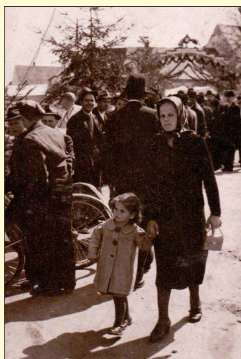
Mama in sestra Jožica pred vojno