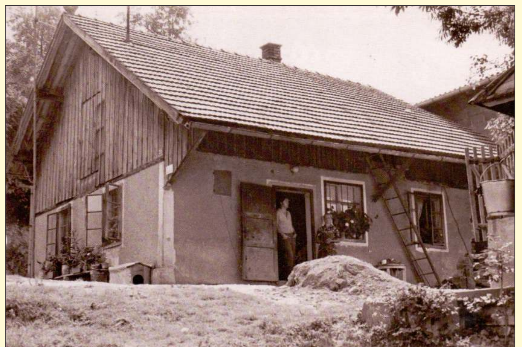
Prva zares Partljičeva hiša