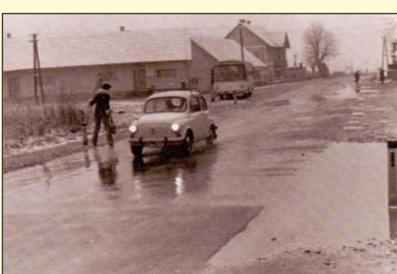
Prvi fiček v Pesnici