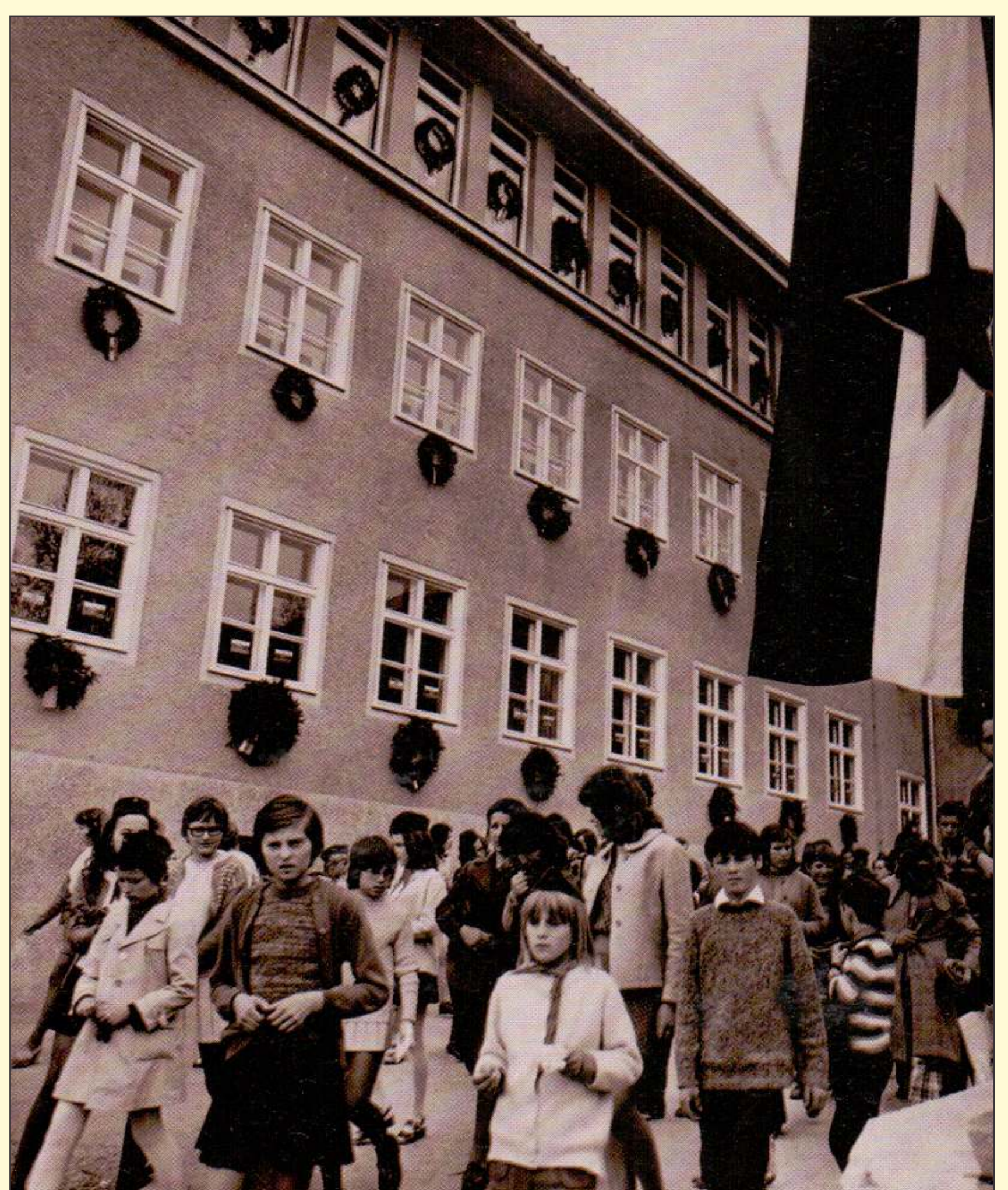
Sola v Pesnici, kjer je mali Tone vsrkaval prva znanja

Je pa mama malo kasneje neko dopoldne, ko več ni hodila delat na Pilčeva polja, ker Pillzev ni bilo več, poklicala otroke, da bi videli nenavaden prizor. Iz Gornikove grabe so ob robu gozda prihajali vojaki, komaj so se privlekli do vrha, posedli so okoli hiše, mama je rekla, da jih je bilo gotovo sto, in potem jim je dala nekaj veder mrzle vode (studenc smo imeli v kleti), ki so jo z zajemalko pili.