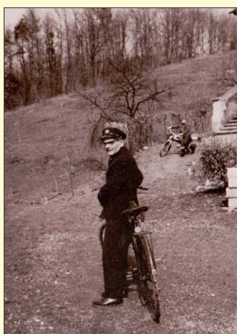
Ata Franc odhaja v službo