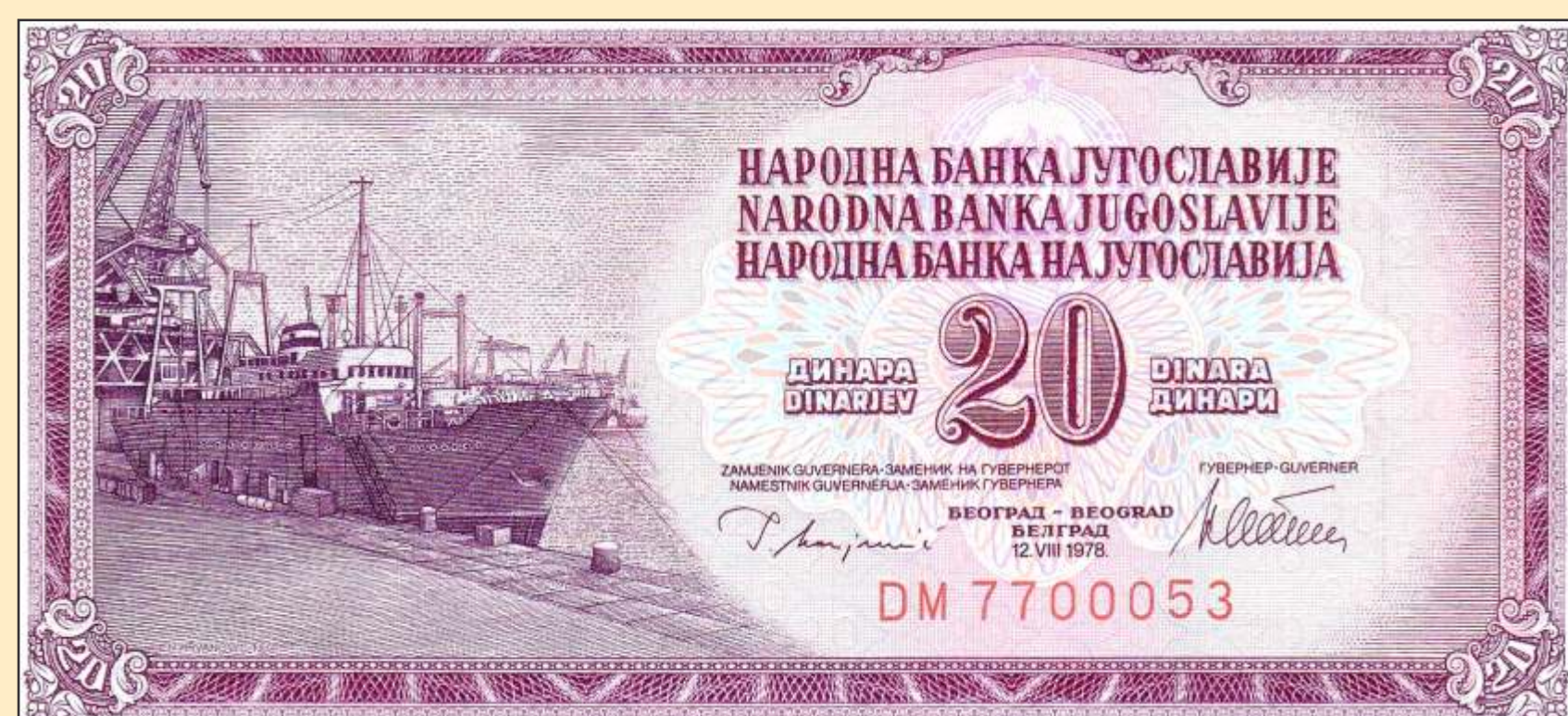
20 ukradenih dinarjev