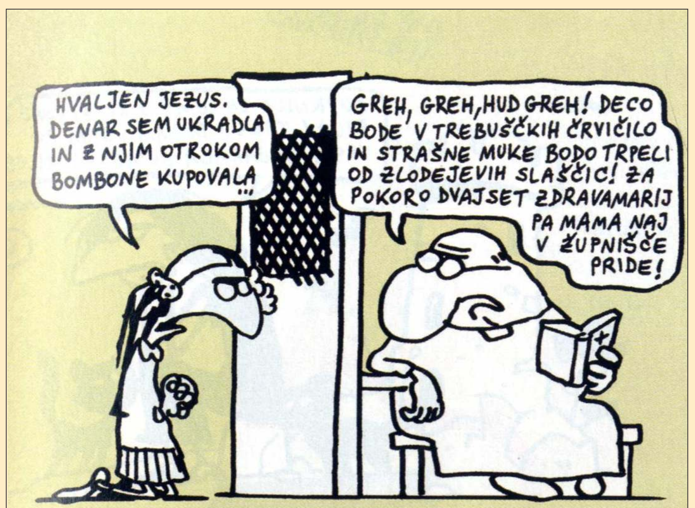
Pokora za krajo