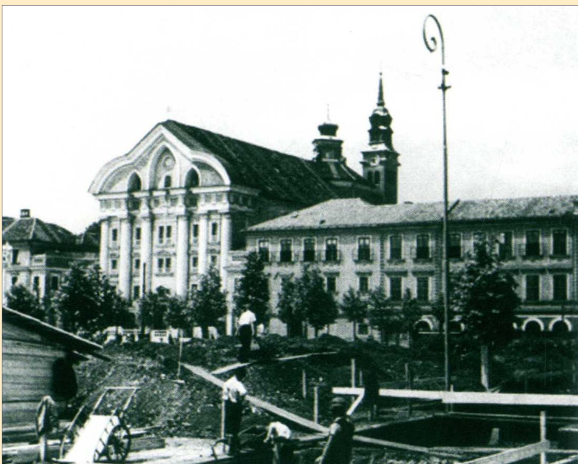
Povojno obnavljanje ruševin

Še posebej zoprna ji je bila spoved, saj župnik ni spoštoval zaveze molčečnosti, ampak je o vseh Svetlaninih grehih sproti obveščal njeno mamo. Tako je na dan prišel tudi podatek, da je iz kredence ukradla 20 dinarjev, z njimi kupila dve vreči bonbonov in na posladek povabila vse otroke iz sosesčine.