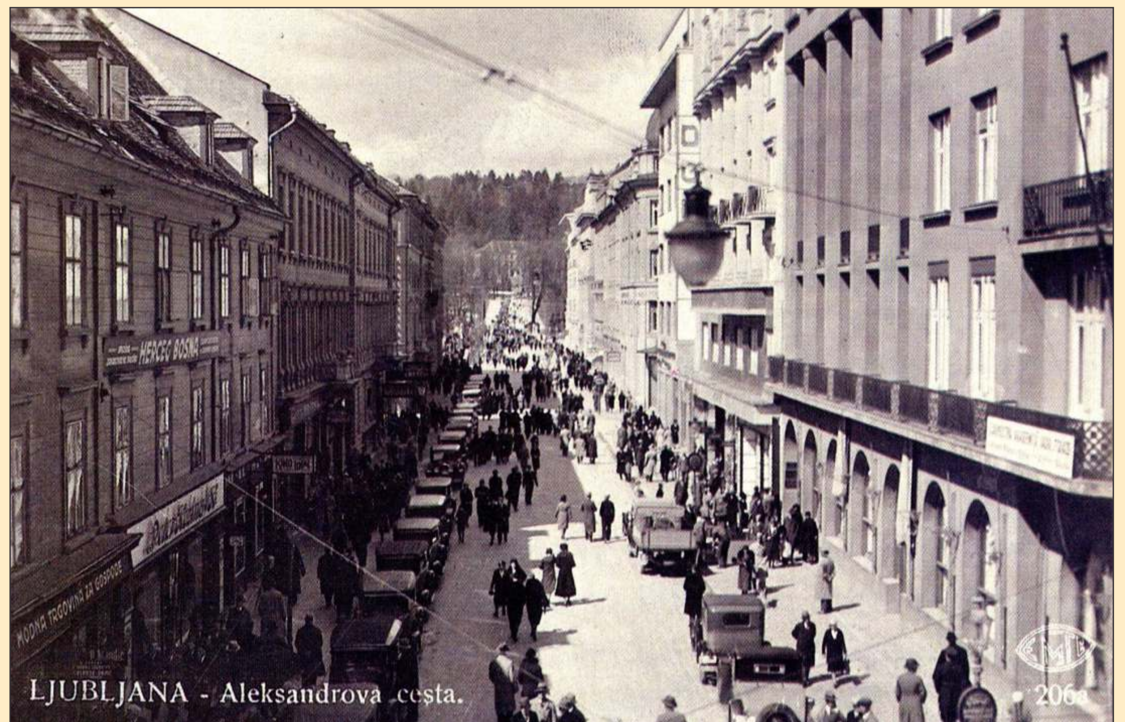
Ljubljana med drugo svetovno vojno