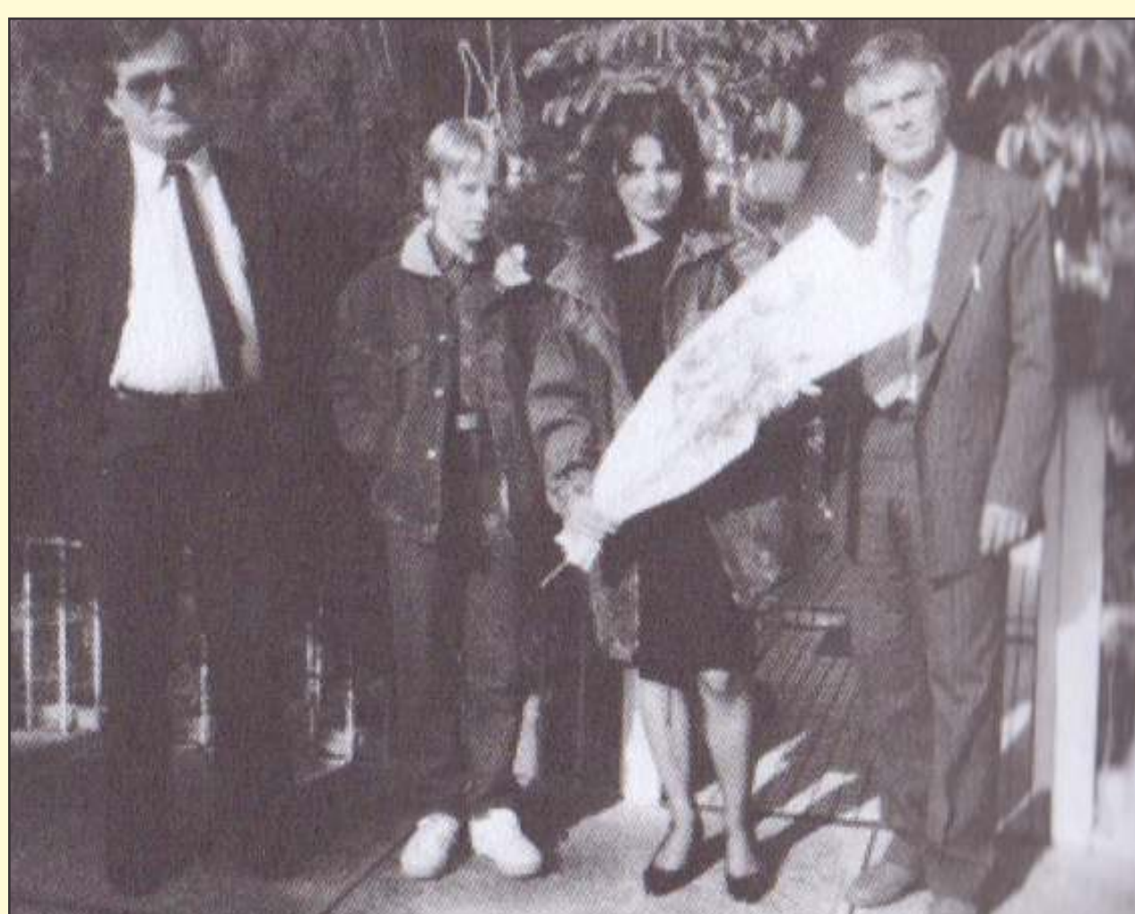
Na gostovanju komedije Moj ata, socialistični kulak v Avstraliji

»Proces pisanja se pri meni začne kot slutnja, zamisel, nekakšna 'oploditev'. Pravim, da sem zanosil. Takšno zamisel nosim v sebi več let, dokler mi notranja nujna ne da več miru. /.../ Začne se garasko ustvarjalno delo, ko je treba sedeti in tipkati. Takrat potrebujem koncentracijo in predosem mir. Proces pisanja je kot rojevanje. Delam, tipim, mečem liste, sprosti korigiram. In tako napišem dramsko besedilo. Nato svoje delo izmučen, prazen in nezaupljiv skrijem v predal pred samim seboj.«