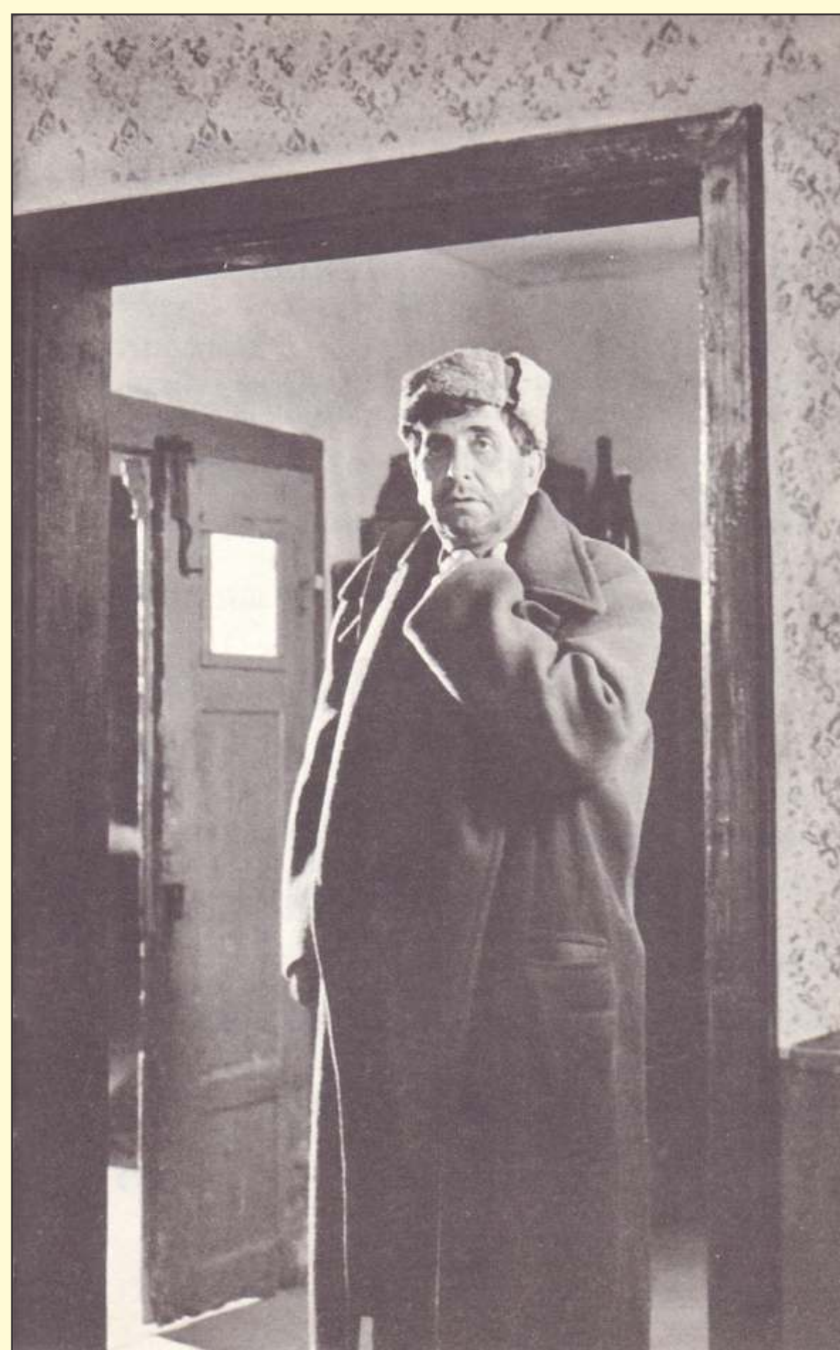
Prizora iz filma Moj ata, socialistični kulak