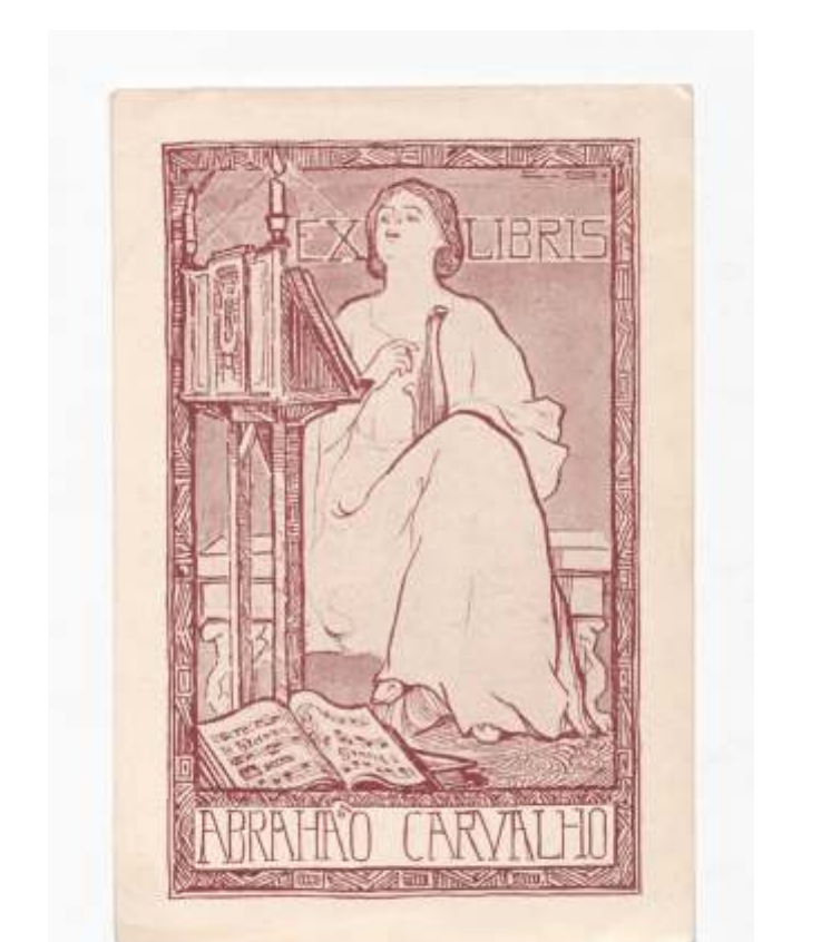
Abrahao Carvalho Peter Wolbrand, tisk, neznano 135 x 84 mm (20)