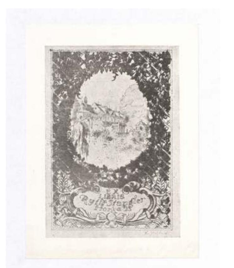
Ryfir Stangler Karel Hojden, tisk, 1945 100 x 70 mm (16)