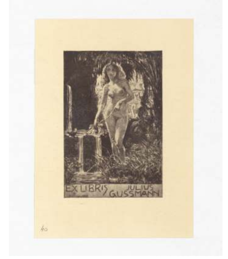
Julius Gussmann Bruno Héroux, jedkanica + tisk, 1911 89 x 60 mm (4)