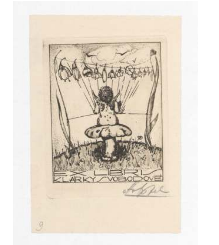
Klára Svobodova Otto Apfel, tehnike na kovinski plošči, 1928 80 x 64 mm (8)