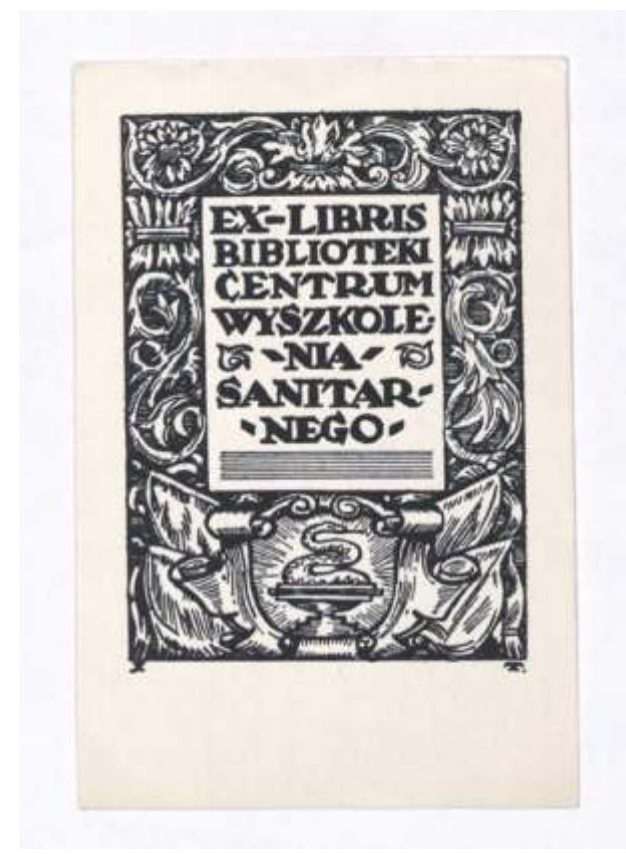
Knjižnica Sanitarnega šolskega centra Józef Tom, visoka jedkanica, 1930 76 x 56 mm (15)