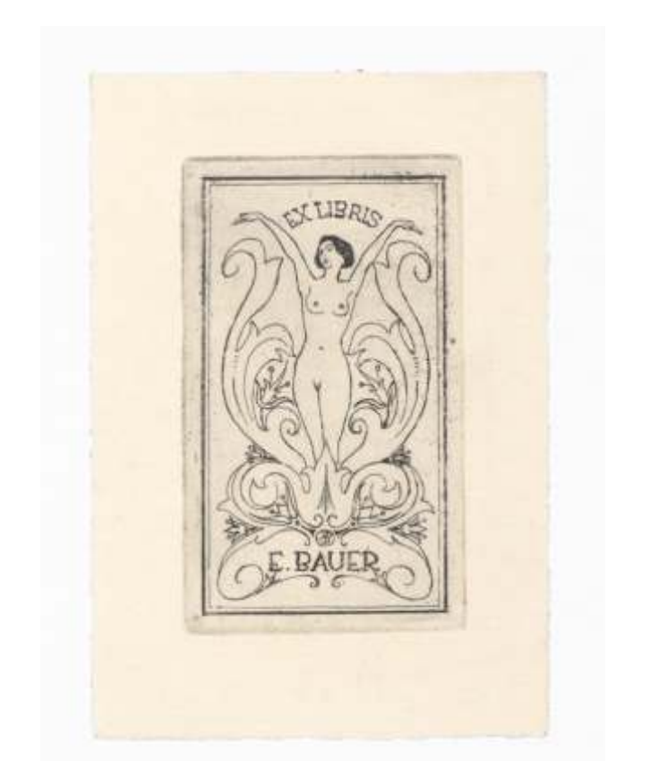
E. Bauer Agost Bayer, jedkanica, 1936 83 x 47 mm (24)