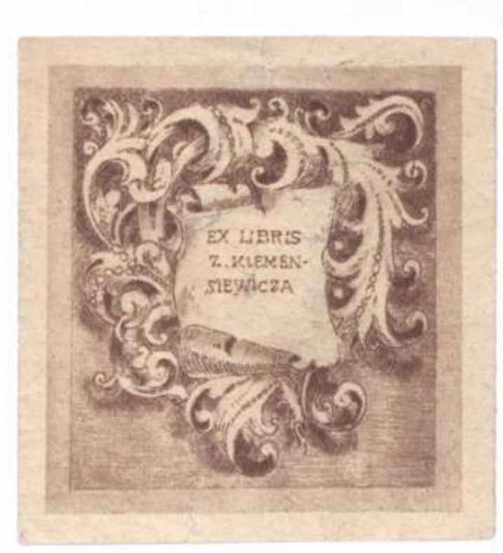
Zygmunt Klemensiewicz Neznani, litografija + tisk, neznano 64 x 56 mm (11)