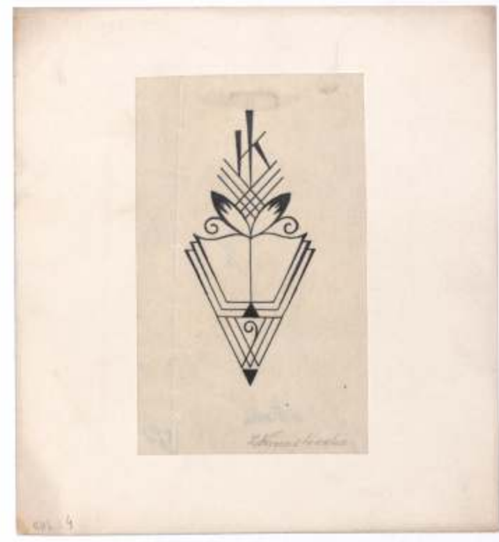
Kazimierz Halaciński – supereklibris Zygmunt Kinastowski, neznana, neznano 42 x 86 mm (2)