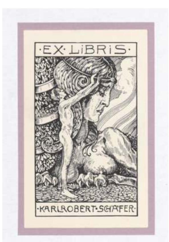
Karlrobert Schäfer F. Schneider, visoka jedkanica, 1918 79 x 46 mm (21)