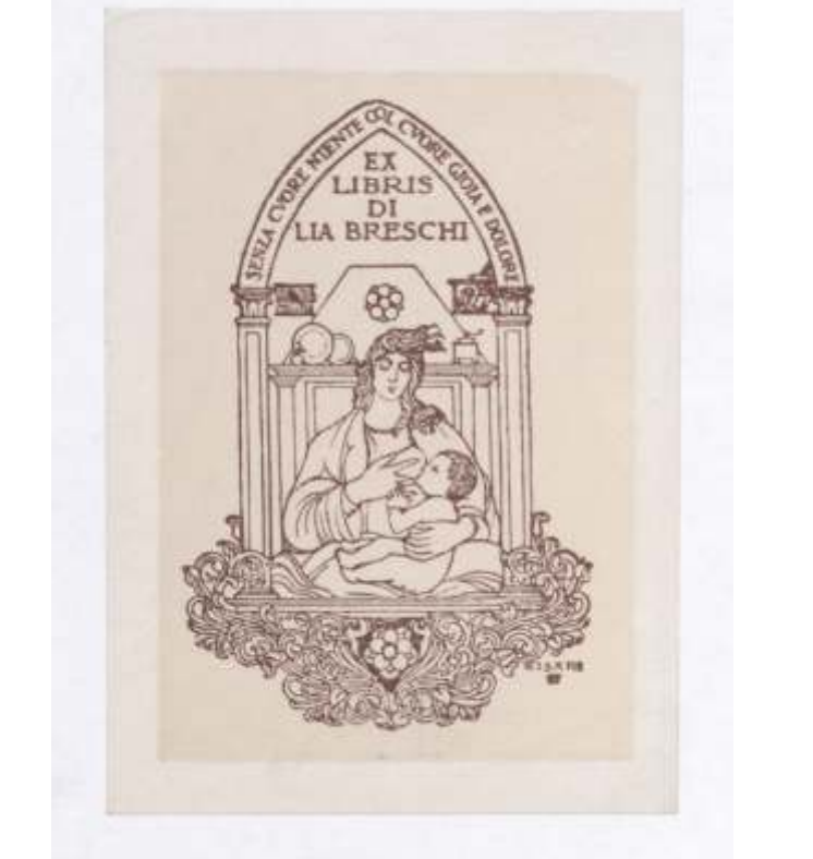
Lia Breschi Giulio Cisari, lesorez + tisk, neznano 91 x 60 mm (12)