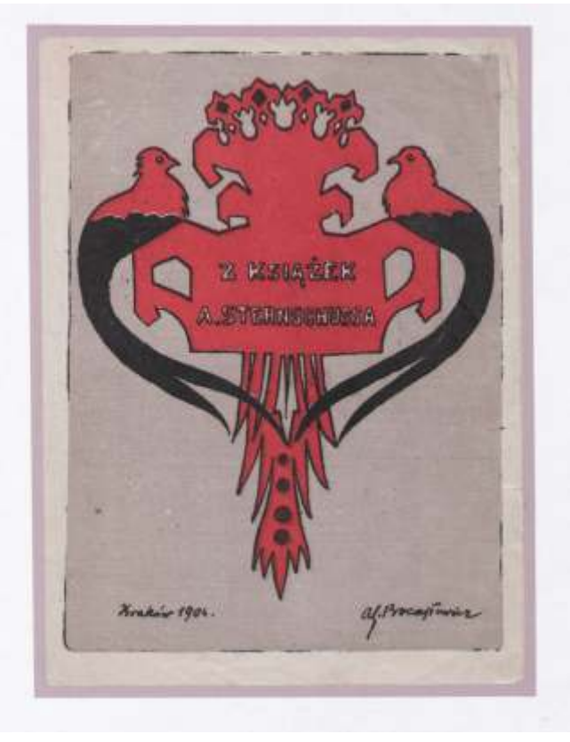
Adolf Sternschuss Antoni Procajłowicz, barwna litografija, 1904 144 x 105 mm (6)