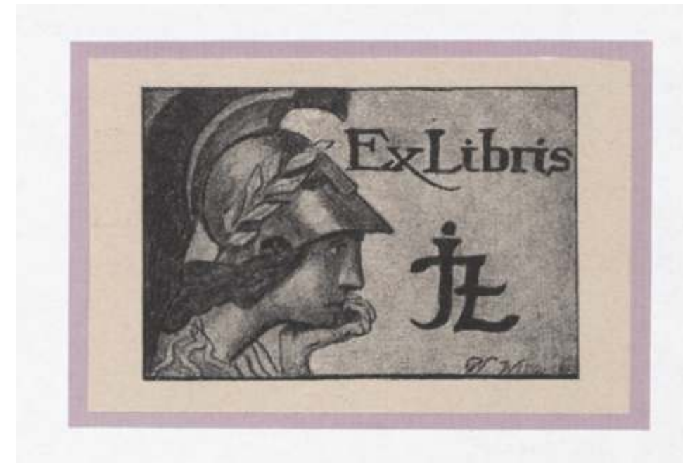
J. Ziembicka Władysław Witwicki, visoka jedkanica, 1917 45 x 68 mm (7)