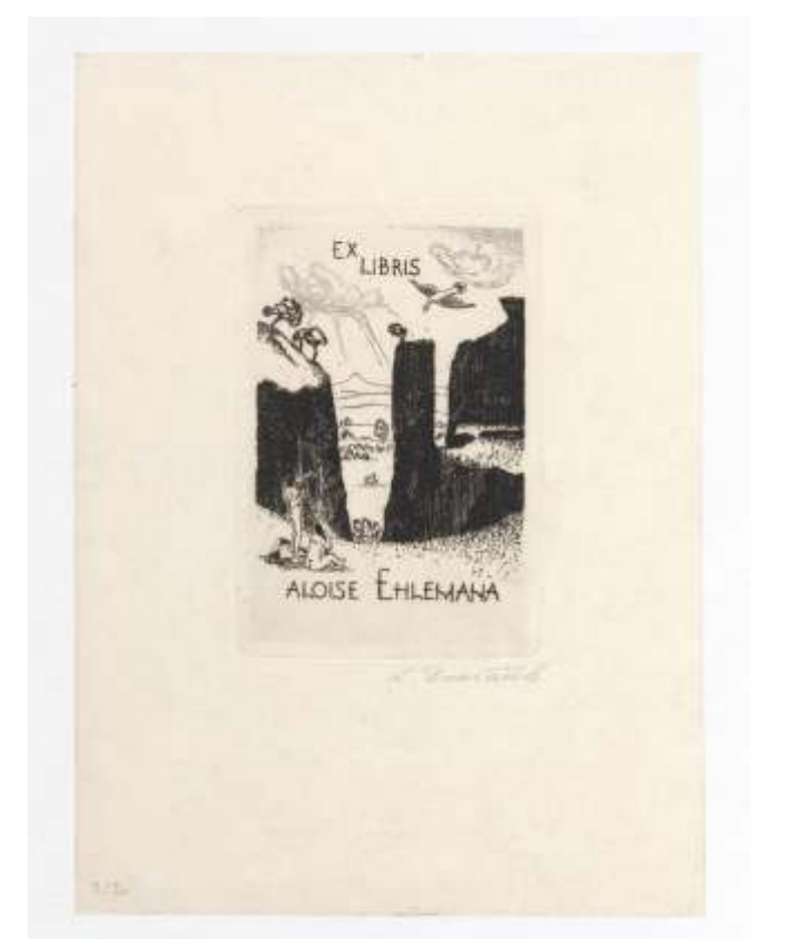
Aloise Ehleman Ludvik Dwořáček, jedkanica, 1926 100 x 73 mm (17)