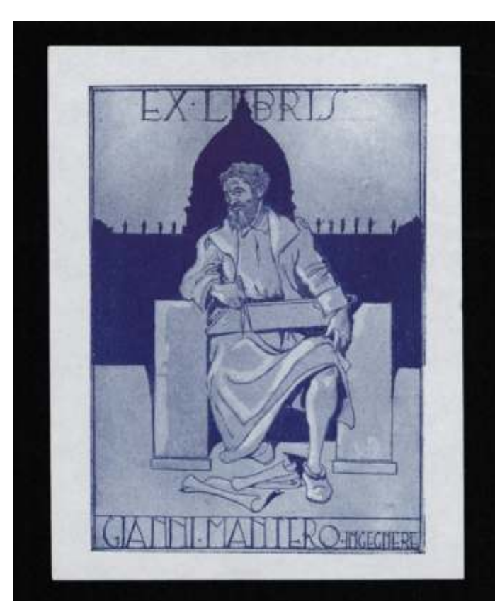
Gianni Mantero Sergio Burzi, tisk, neznano 96 x 69 mm (23)