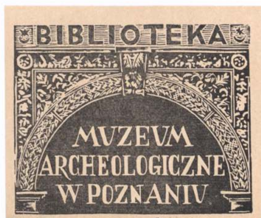
Knjižnica Arheološkega muzeja v Poznanju Tadeusz Żurowski, linorez, 1968 65 x 82 mm (14)