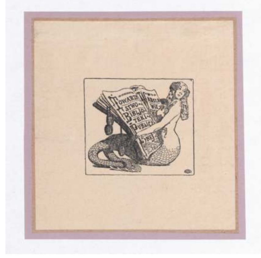
Društvo javne knjižnice v Varšavi Edward Okuń, visoka jedkanica, 1907 47 x 53 mm (3)