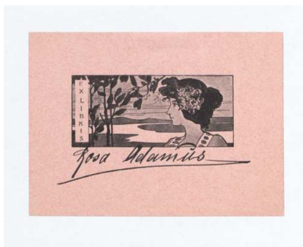
Rosa Adamus Ilse Conrat, tisk, 1899 45 x 78 mm (9)