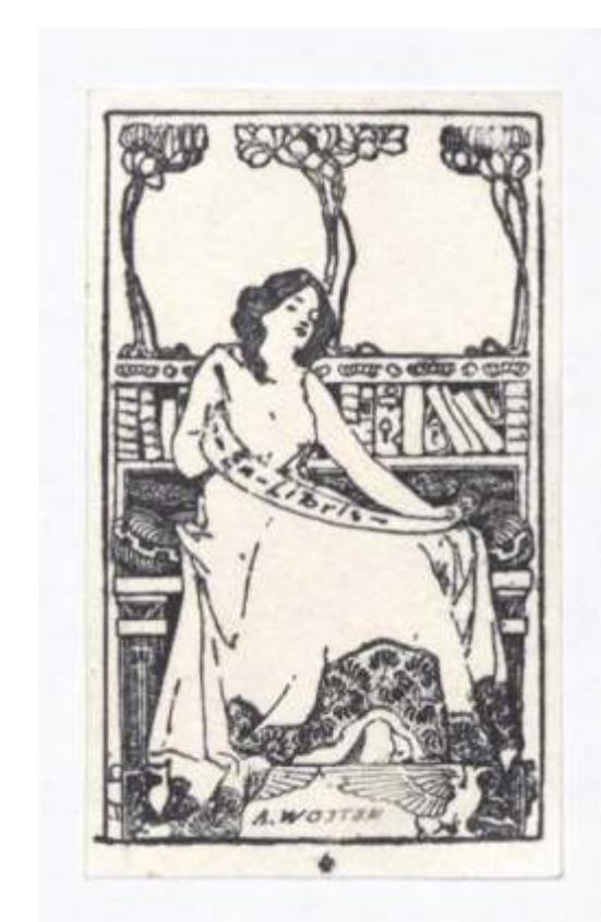
A(dam) Wojtan Adam Pótlawski (?), gravura, neznano 74 x 45 mm (19)