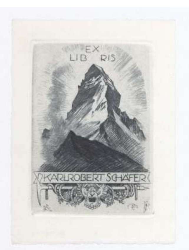
Karlrober Schäfer Alfred Soder, jedkanica, neznano 104 x 73 mm (18)