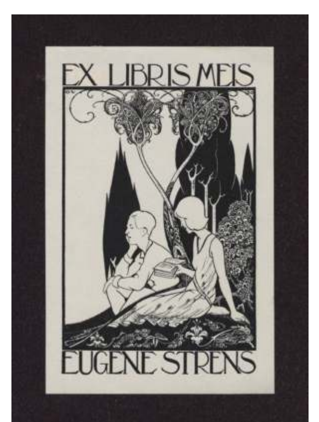
Eugene Strens Otto Verhagen, visoka jedkanica, 1930 104 x 65 mm (22)